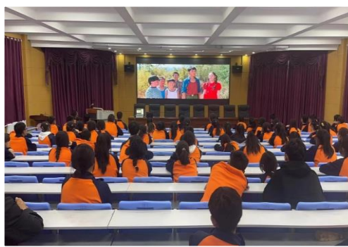
（贵德县民族完全小学）