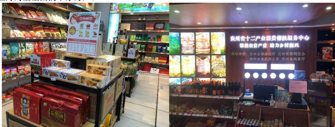
(贵州省十二产业消费帮扶服务中心)

2023 年上半年，根据《中共中央国务院关于做好 2023 年全面推进乡村振兴重点工作的意见》的总体部署，公司旗下东方购物以“走出去-盘活原产地优质资源”，“引进来-双向赋能聚力增效”为双重抓手，深入新疆伊犁、福建三明、福建宁德、四川甘孜、贵州等地城镇乡村考察调研，与地方乡村振兴局洽谈合作，发挥自身供应链、内容制作、整合营销长板，依托上海大市场、大平台、大流通优势，持续推进“农文旅消费+广电媒体+零售+产业合作”一体化充分融合，助力乡村源头特色好物出山出海，走入上海乃至全国的千家万户。