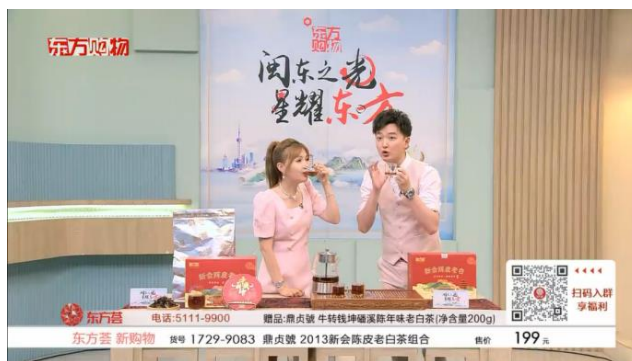
(东方购物 12 频道“闽东之光 星耀东方”宁德农文旅商品特别大直播)