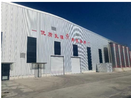
(新疆伊犁那拉集团骆驼奶粉厂家)