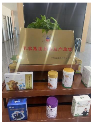
(新疆伊犁那拉集团骆驼奶粉厂家商品展示)

下阶段东方购物将进一步贯彻上海市委市政府“立足对口地区资源禀赋，多措并举深化消费帮扶”要求，对接青海果洛、云南楚雄、安徽六安等上海重点对口帮扶地区，帮助他们更好立标准、提品质、打品牌，创新帮扶方式，深化双向赋能，助力地区产品找到销路、企业开拓市场，做精做细做实合作文章，更好履行和体现东方明珠新媒体的企业社会责任，抒写乡村振兴新篇章。