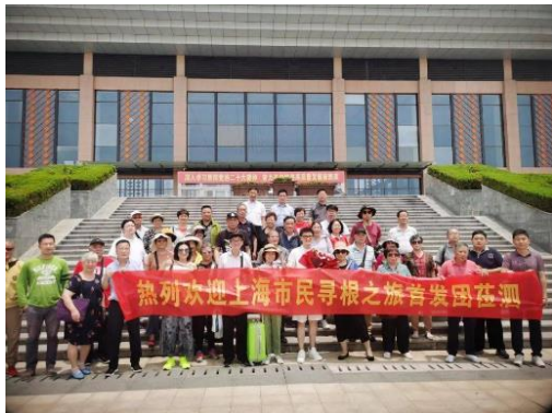
(江苏泗阳“寻根之旅”首发团)

下阶段东方购物将进一步贯彻上海市委市政府“立足对口地区资源禀赋，多措并举深化消费帮扶”要求，对接青海果洛、云南楚雄、安徽六安等上海重点对口帮扶地区，帮助他们更好立标准、提品质、打品牌，创新帮扶方式，深化双向赋能，助力地区产品找到销路、企业开拓市场，做精做细做实合作文章，更好履行和体现东方明珠新媒体的企业社会责任，抒写乡村振兴新篇章。